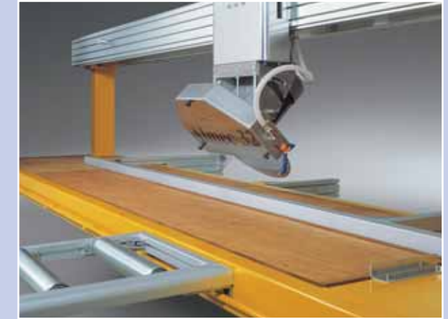
Inclinazione testa da 0° a 45° Tilting head for cutting from 0° to 45°