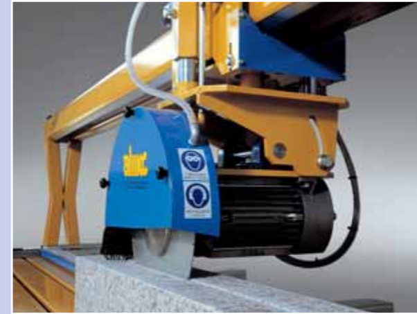
Lavorazione del granito. La ST320BQ può tagliare pietra, marmo, granito, calcestruzzo. Works on granite. The ST350BP is able to cut stone, marble, granite, concrete.