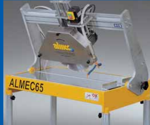
Inclinazione testa da 0° a 45° Tilting head for cutting from 0° to 45°